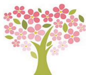
わたしのお家！5歳女兒の作品