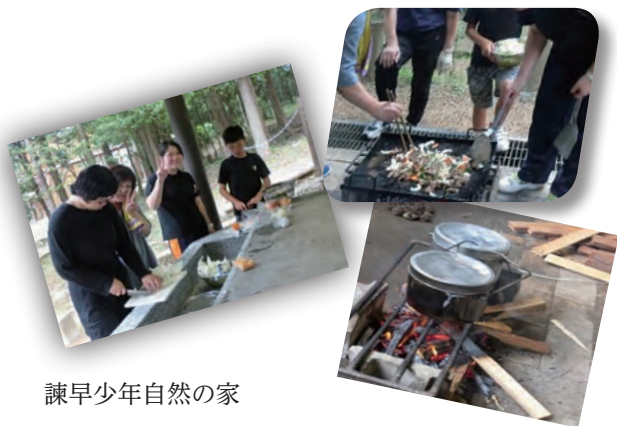
諫早少年自然の家