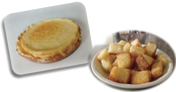
クッキングの課題（中学生）