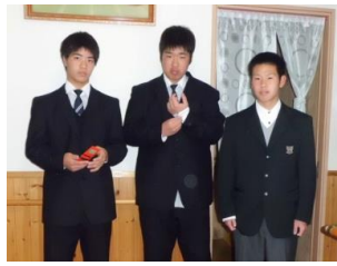
D N 君 Y O 君