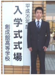
創成館高校 Y T 君